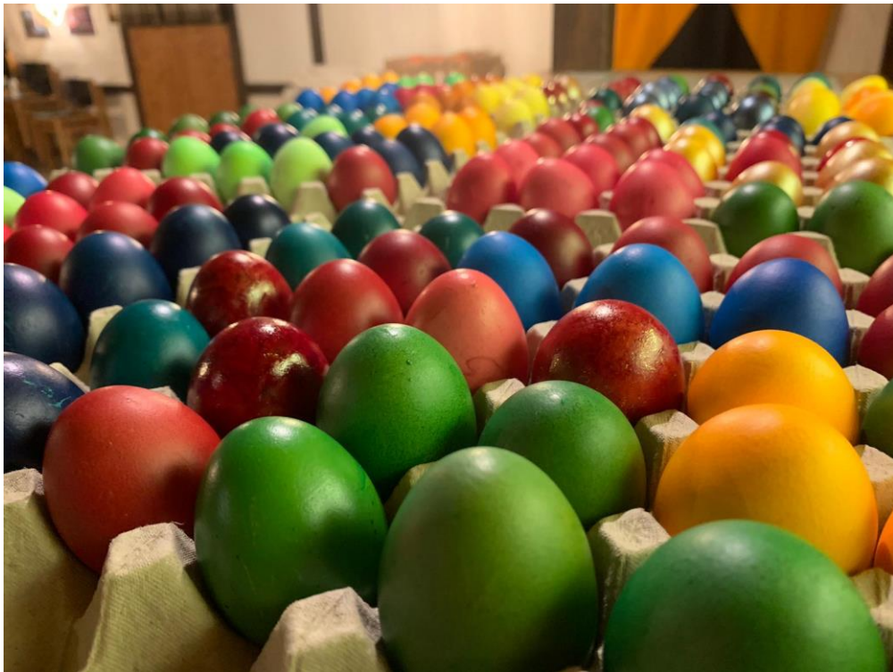
Übersicht der diesjährigen gefärbten Ostereier

An Gründonnerstag, 18.04.2019 haben 8 Männer die vorhandenen 600 Eier gekocht und mit bunten Farben eingefärbt. Teilweise wurden die Eier auch mit spezieller Technik bearbeitet und so marmorierte Oberflächen erzeugt.