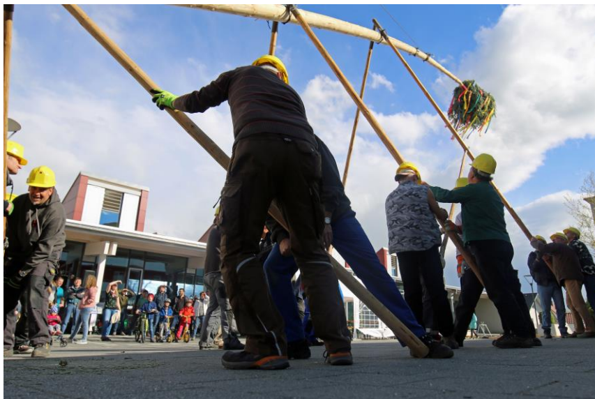
Maibaumstellen auf dem Dorfplatz

30.04. Stellen des Maibaums - ab 16:00 Uhr auf dem Dorfplatz