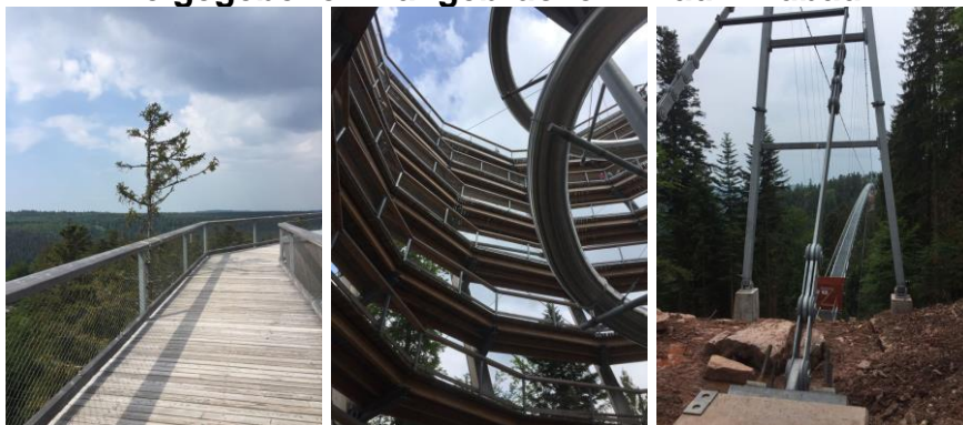
Alle Bilder: Hans-Georg Maier