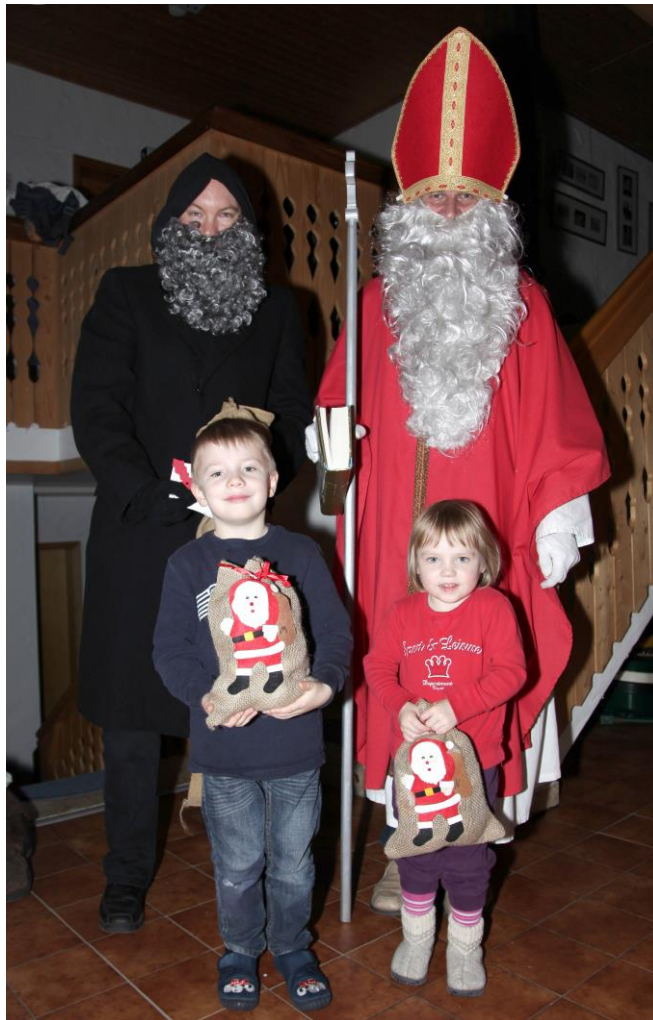
Nikolausbesuch im Jahr 2013

Die traditionellen Nikolausbesuche sind auch in diesem Jahr wieder Bestandteil unseres Programms am 05. und 06. Dezember.